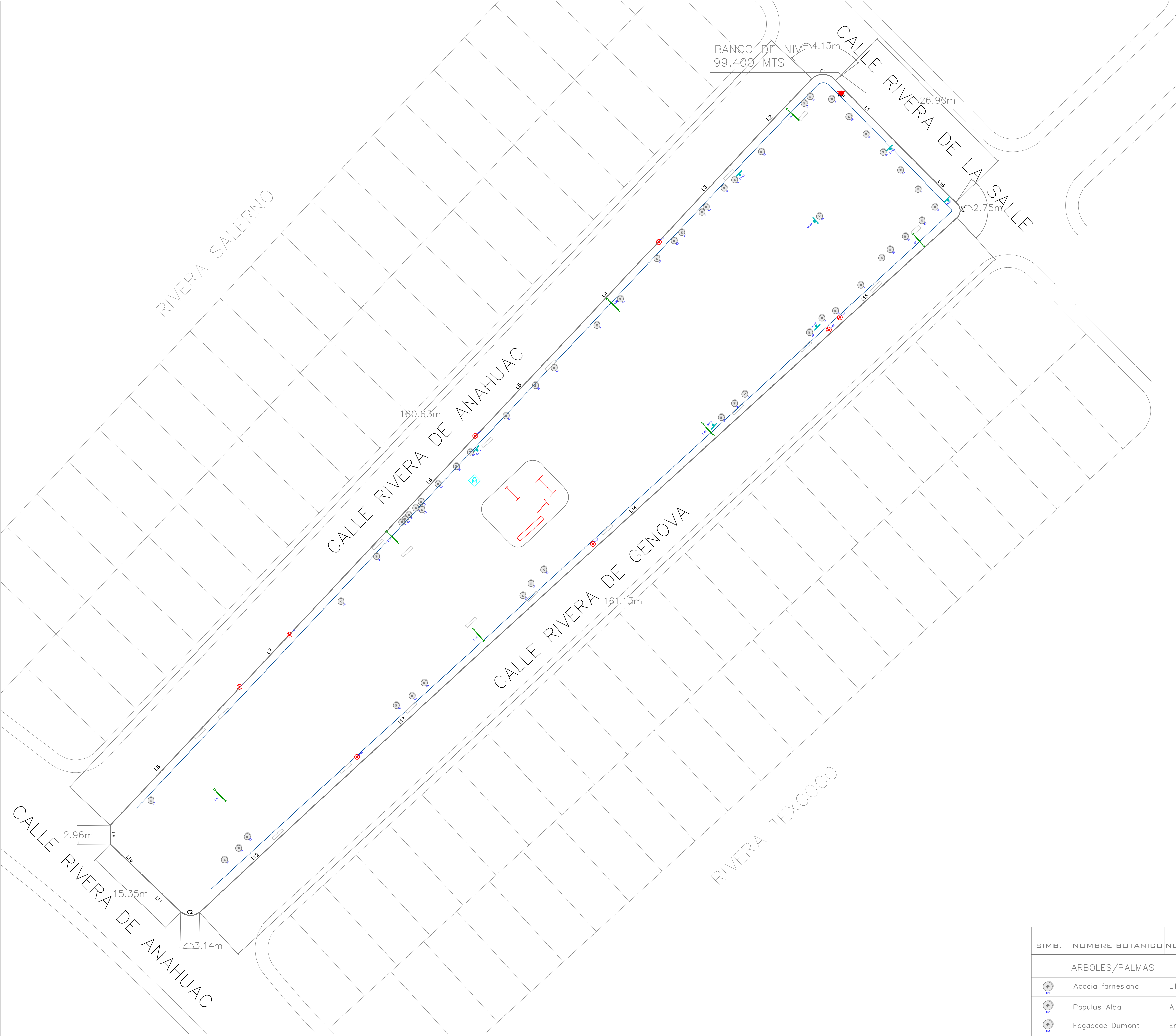
PLANTA DE LEVANTAMIENTO FISICO / CENSO BOTANICO